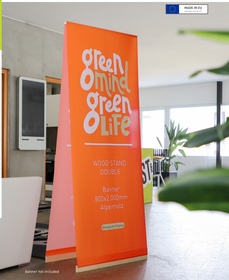
banner not included

The double-sided solid wood stand for fabric prints with hemstitch impresses with its sustainable, regional production and simple handling. It is easy to transport and can be set up in a few simple steps. Made of untreated FSC-certified solid wood from South Tyrol/Trentino, it is the ideal presenter for shops and trade fairs thanks to its tool-free assembly and banner change.