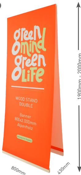
banner not included